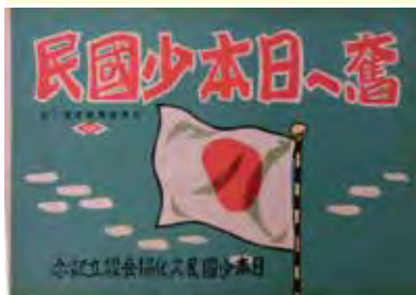
・昭和16年、「もうコドモではない。立派に国を背負う少国民だ。少国民奮起せよ！」タイトルの横書きは昭和16年までは右から。