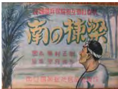
・戦場に徴用される民間人を軍属と言う。これは大工さんの話。「残されたコドモのために保険をかけよう」。保険会社の紙芝居。