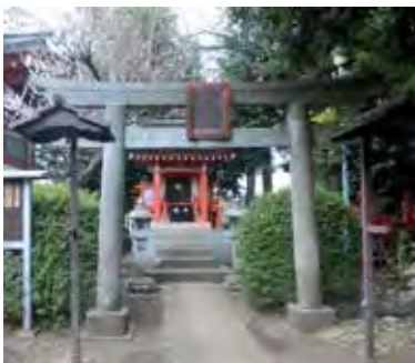
・小金井市本町の稲穂神社境内にある疱瘡神社。元は別の場所にあったが、明治年間に移設されたとのこと。

◆『武蔵野の歌が聞こえる』舞台写真、上演の動画はシニアSOHO小金井のホームページで視聴できます。