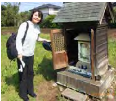
・石祠が劣化しないよう、切妻づくりの木祠で守られている。

享保17年、押立村平右衛門、中野村源助、柏木村弥兵衛ら名主の連名で、幕府に疱瘡(ほうそう)予防のため、象洞(そうぼら)の販売を願い出た古文書がある。疱瘡とは天然痘のこと、当時は予防法のない恐ろしい病気だった。象洞とは象の糞から製薬した予防薬で、將軍吉宗がタイから輸入した象の糞を使ったものだ。当時白牛糞からの製薬も試みられており、時代的制約の中で幕府も予防法を模索中であった。これを象のクソで金儲けをした平右衛門は利殖の達人だと言う人もいる。わたしはそうは思わない。平右衛門は名主であり、象洞で得た金は府中大國魂神社の随神門建設に寄進している。小金井には疱瘡神社のお宮がある。幕末に牛痘法による予防接種が可能になるまで、疱瘡が流行すると人々はひたすら神に祈るしかなかったのだ。