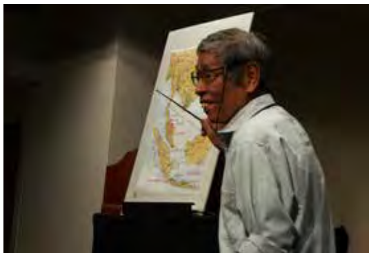
・「もうコドモではない、少国民奮起せよ!」、どこかで聞いた言葉だ。少国民はどこまで大切な記憶を伝えられるか。