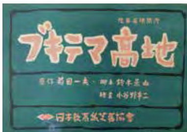
・大東亜戦争の開始、シンガポール攻略戦でイギリス軍と死闘を重ねたブキテマ高地。